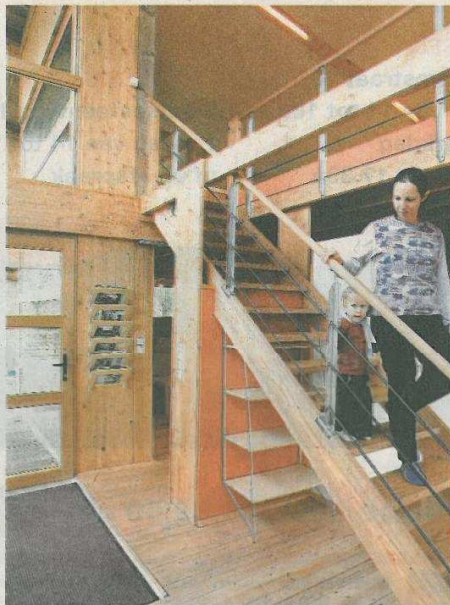
■ Het credo van dit huis: simpel en duurzaam.

als het ware een betonnen boot gecreëerd. Die perfect waterdichte kuip zorgt ervoor dat de ondervloer in strobale niet nat kan worden.» Strobale vormen ook het onderdak. «We gebruiken samengeperst stro. Het isoleert net zo goed als een laag van 45 cm rotswol. En zover gaat niemand.» Al even goedkoop en nuttig is de leem waarmee de muren binnen en buiten werden bezet. «Hier vlakbij had men een kelder uitgegraven voor een nieuwbouw. De eigenaars wisten geen blijf met de leem. Het kostte ons een appel en een ei, ze waren blij dat we hen verlost van die troep.» De leem wordt deels vermengd met kalk en vlaskaf. Dat kaf van vlas is