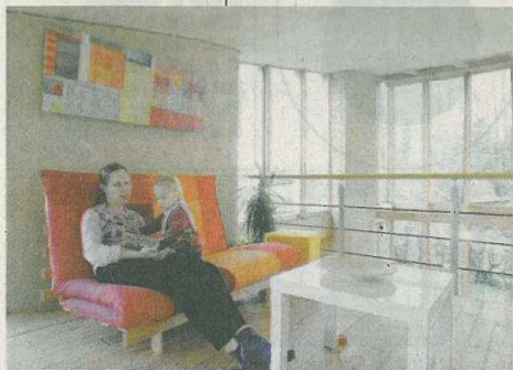
■ Zalig nietsdoen is in deze woning een constante.