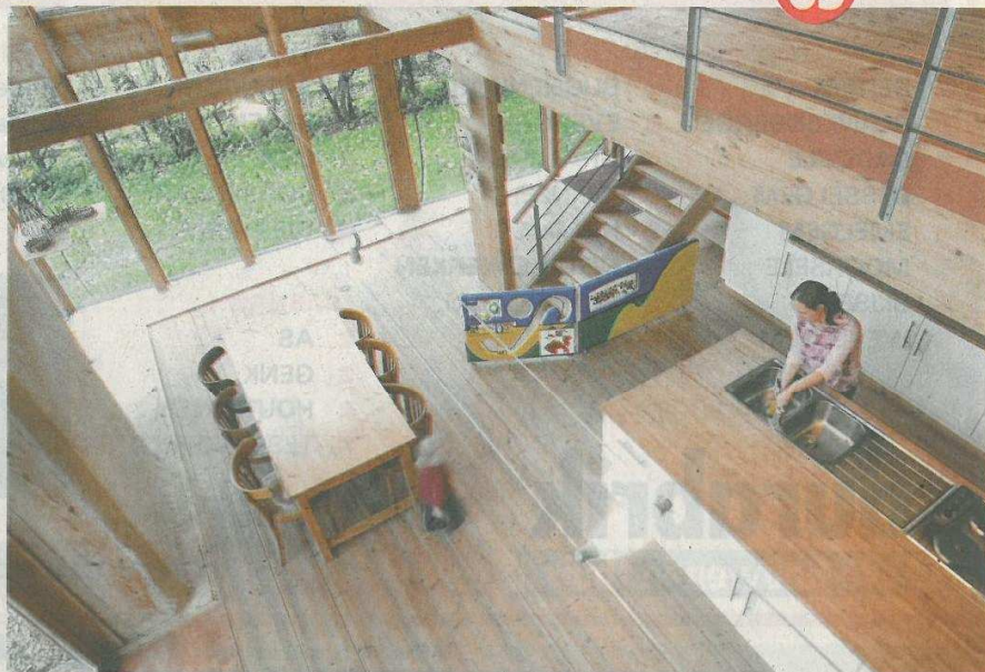
■ In de vide is hout alomtegenwoordig en laten grote ramen licht in overvloed doorsijpelen.

belangrijk, want anders krijg je barsten. Bij de inkom en aan de zoldering werd het stro op bepaalde plekken niet verstopt achter hout. «Bewust, want zo krijgen we echt het pure gevoel dat eigen is aan een strobalewoning.» De speciale EDPM-folie op het dak laat zich vlot begroeien met gras en kruiden. «Dat is extra isolatie, en daardoor versmelt het geheel nog intenser met de groene omgeving.»