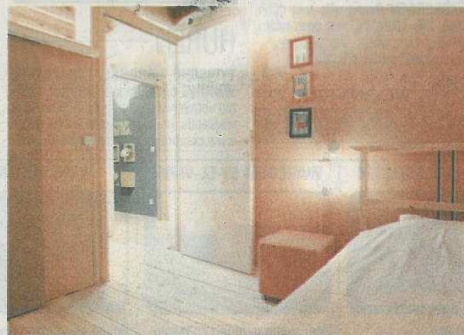
■ In de master bedroom werd het vliesbehang met okerkleurige natuurverf geschilderd.