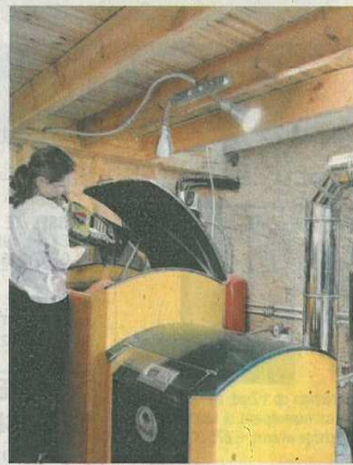
■ De verwarmingsketel wordt gevoed met pellets.

aparte kamer, stoorzenders die de ouders liever uit hun interieur bannen. Zo kunnen de kinderen er toch van genieten. In de badkamer is er een vloer in kurk, elders ligt parket. Ter afwisseling voor de leem zijn sommige wanden in OSB. Zulke armdikke platen worden gemaakt van gerecupereerde houtsnippers. In de master bedroom werd het vliesbehang met okerkleurige natuurverf geschilderd. De muur in leem oogt er donkerder doordat iets minder kalk in het bezetsel werd verwerkt. Een vide voorziet de slaapkamers van licht. Maar bij de kinderen hangen er doeken, anders wachten hen slapeloze nachten. De hobbyruimte op de overloop biedt een zee van ruimte. Blikvanger is een muur van ongebakken leemstenen. Boven is er ook nog een verzonken salon, maar het balkon wordt het meest benut om te verpozen. «Onze avonden brengen we vaak al wiegend door, loom in onze hangstoelen. Bijpraten, wat lezen, een